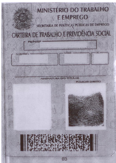
Página de rosto (frente)