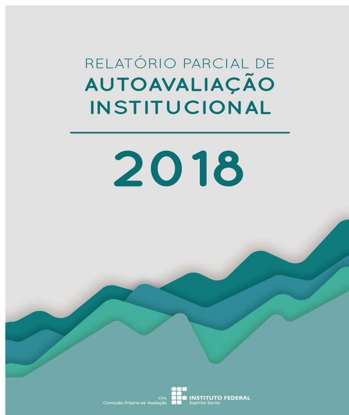
Figura 3: Capa do relatório parcial de 2018

No campus Vila Velha a divulgação se deu por meio de reuniões com os segmentos docentes e técnicos administrativos. Foi realizada também uma reunião com o curso de bacharelado em Engenharia de Controle e Automação. Para os demais segmentos os resultados foram divulgados por meio de cartazes e a publicação do relatório no site do Ifes.